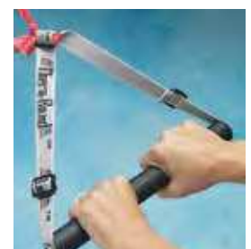
950-127 Asa ancha 1 u.