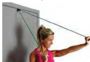
950-126 Ancla puerta 1 u.