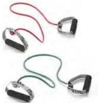
Con asas acolchadas 1,22 m.