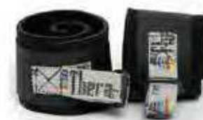
950-128 Correa para tobillo 2 u.