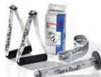
950-124 Kit de accesorios