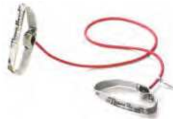
Con asas flechibles 1,4 m.