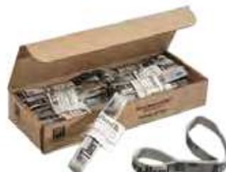
950-129 Loop 1 u.