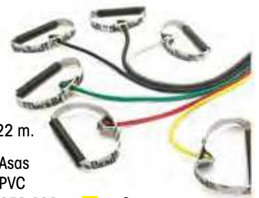
Asas PVC 1,22 m.

Asas acilchadas 953-030 953-031 953-032 953-033 953-034 953-035