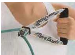
950-125 Asa estrecha 2 u.